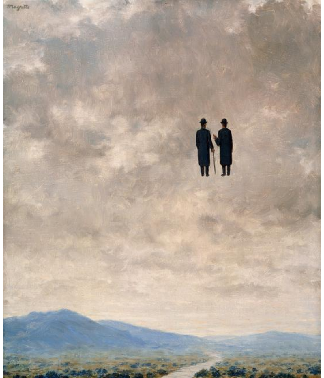
René Magritte (1963), El arte de la conversación .

La conversación, como diálogo, coloca a los conversadores en una posición espacio-temporal distinta, provocando una nueva perspectiva (discurso) de la realidad.